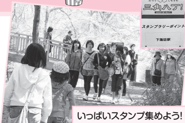
いっぱいスタンプ集めよう!