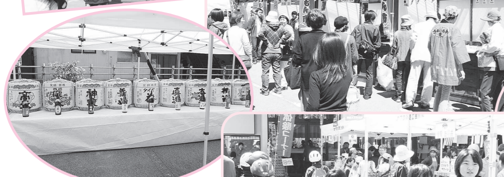
おいしい物に、 おいしいお酒!! フリーマーケットも大盛況!!