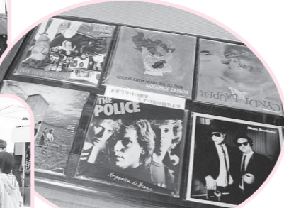
下諏訪町をもっと観光しよう!!